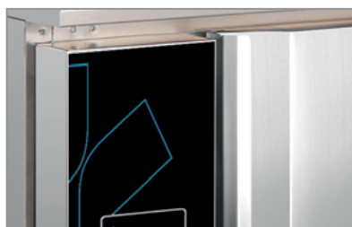
Termostato elettronico con 4 programmi Electronic thermostat equipped with 4 setting programs