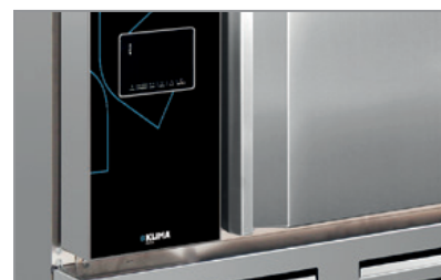
Superficie esterna in acciaio inox AISI 304 AISI 304 stainless steel body