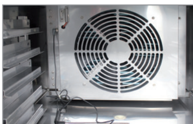
Sonda di raggiungimento temperatura prodotto Product temperature probe