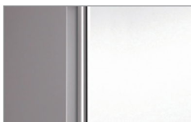
Maniglia integrata Built-in handle