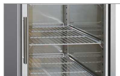
Porta vetro - Modelli TNG/BTG Glass door - TNG/BTG model