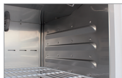
Lamiera interna stampata Thermoformed stainless steel innerliner