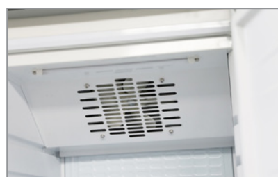
Ventola assiale (versione TN) Axial fan (TN model)