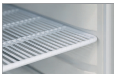
Mensole rinforzate (versione TN) Reinforced shelves (TN model)