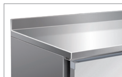
Superficie esterna in acciaio inox Stainless steel body