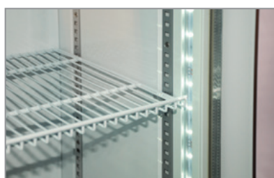
Luci led Led lighting