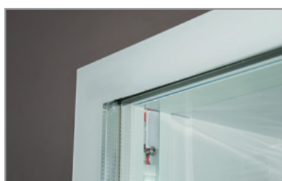
Porta vetro senza cornice Full glass frameless door

Dati indicativi e variabili a seconda dei diversi packaging / Variable data depending on the different packaging