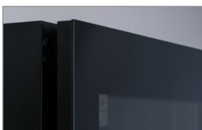
Porta vetro senza cornice Full glass frameless door

Dati indicativi e variabili a seconda dei diversi packaging / Variable data depending on the different packaging