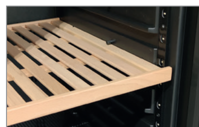
Mensole in legno - Optional Wooden shelves - Optional