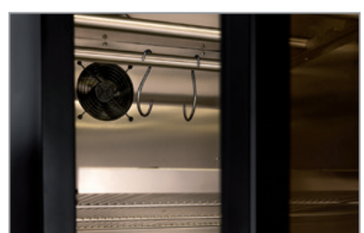
Barre per appendimento Hanging bar

Armadio per conservazione di salumi e formaggi. Cabinet for cheese and cold cuts storage.