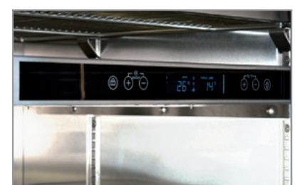
Termostato elettronico touch control Touch control electronic thermostat