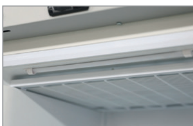
Illuminazione LED LED lighting