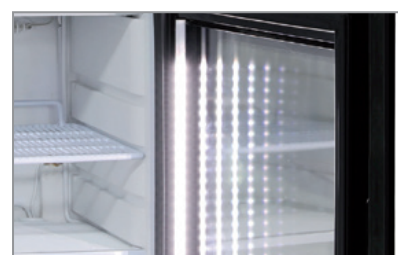
Illuminazione Led Led lighting