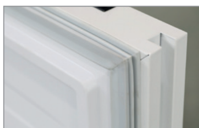
Maniglia integrata Built-in handle