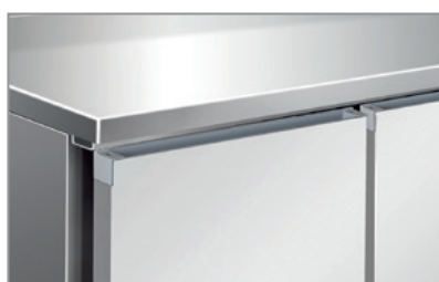
Superficie interna ed esterna acciaio inox Stainless steel body and inner liner

CXF 4180 TN - Versione con 4 Cassettere refrigerate da N.2 Cassetti da 1/2 4 refrigerated doors with 2 x 1/2 drawers.