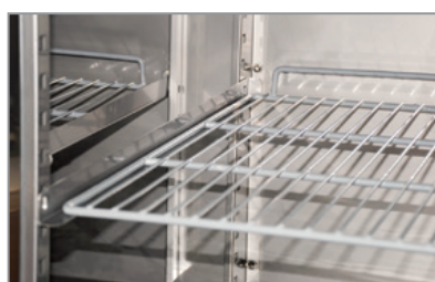
Mensole a scorrimento Sliding shelves