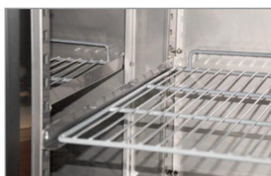
Mensole a scorrimento Sliding shelves