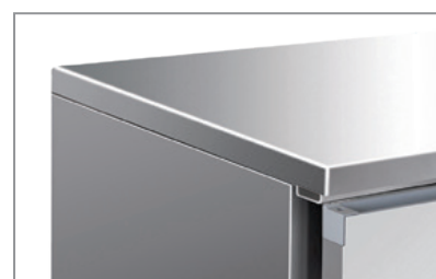
Superficie esterna in acciaio inox Stainless steel body